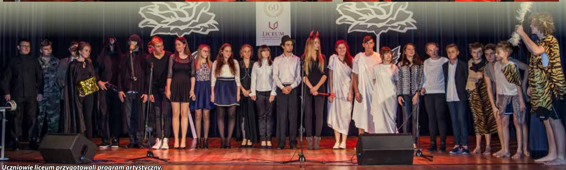
Uczniowie liceum przygotowali program artystyczny.