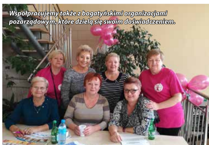
Współpracujemy także z bogatynskimi organizacjami pozarządowymi, które dzielą się swoim doświadczeniem.