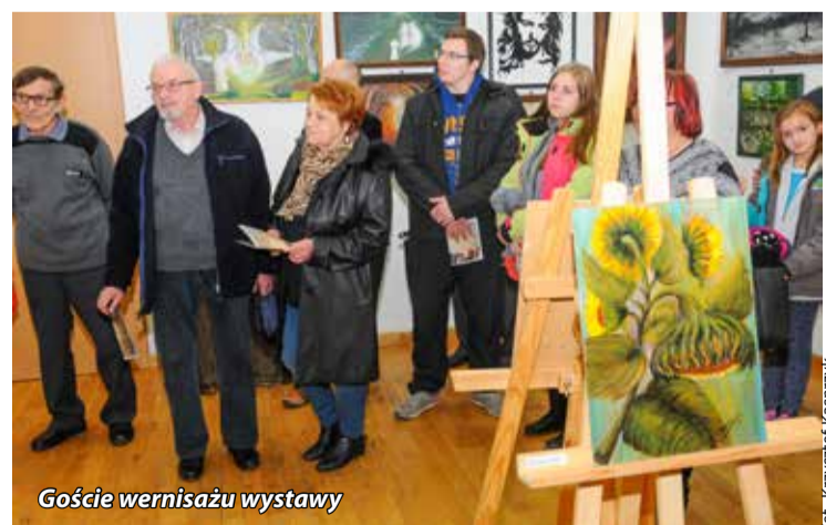
Goście wernisażu wystawy