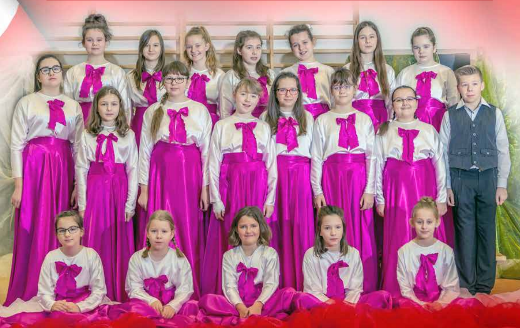
Chór Zespołu Szkoły Podstawowej i Gimnazjum im. św. Jadwigi Śląskiej w Działoszynie