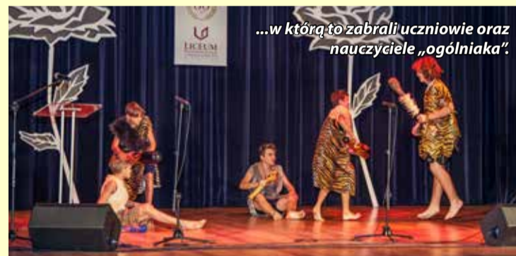
...w którą to zabrali uczniowie oraz nauczyciele „ogólniaka”.