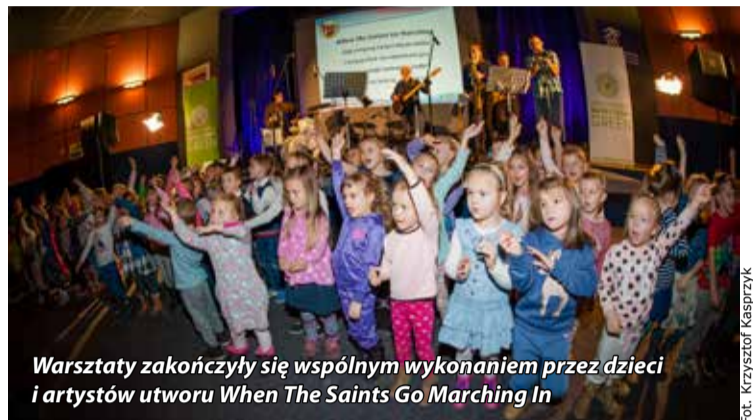
Warsztaty zakończyły się wspólnym wykonaniem przez dzieci i artystów utworu When The Saints Go Marching In