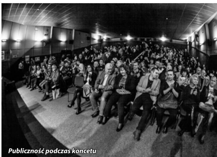
Publiczność podczas koncertu