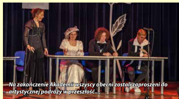
Na zakończenie Akademii wszyscy obecni zostali zaproszeni do artystycznej podróży w przeszłość...