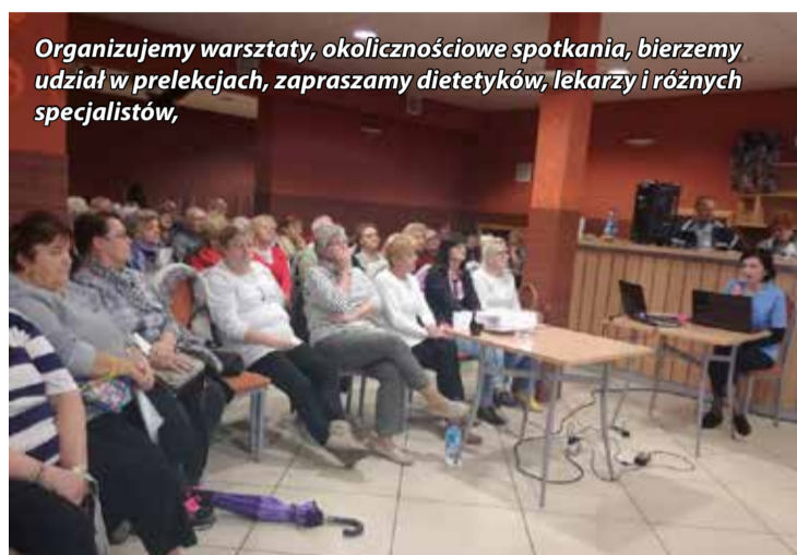
Organizujemy warsztaty, okolicznościowe spotkania, bierzemy udział w prelekcjach, zapraszamy dietetyków, lekarzy i różnych specjalistów,