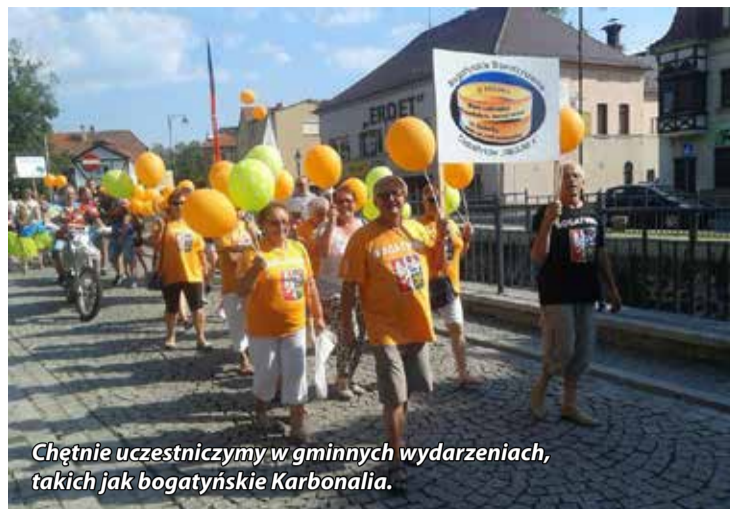
Chętnie uczestniczymy w gminnych wydarzeniach, takich jak bogatynskie Karbonalia.